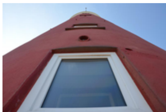
Afbeelding 3: Vuurtoren Texel