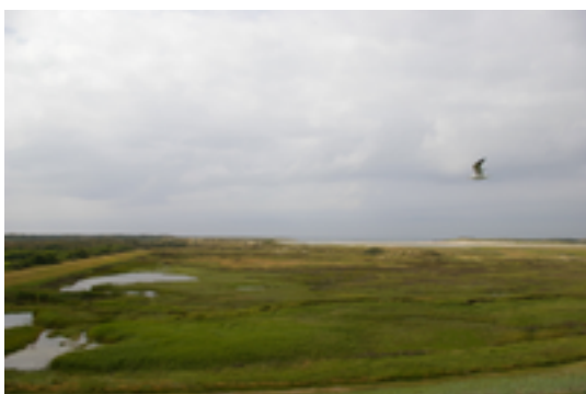
Afbeelding 1: De Slufter

De Slufter is een gebied dat bij hoog water overspoeld wordt door zeewater dat door de duinopening stroomt en de achterliggende zandvlakte overspoelt. Het zeewater loopt wanneer het hoogwater wordt door de krekens de Slufter in en wanneer het laagwater wordt via de krekens de Slufter uit. Je komt hier best eens kijken naar de paarse kleur van dit landschap in juni, omdat dan het lamsoor het oppervlak kleurt en in oktober omdat de kleur dan volledig rood is van de zeekraal. Je kan er ook de eidereend, de lepelaar en tal van diverse steltlopers zien.