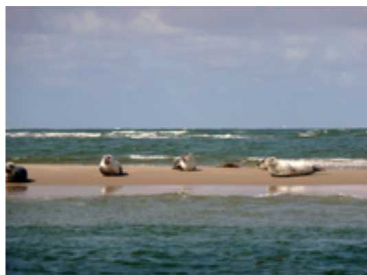
Afbeelding 2: De Zandbank

Dit is een 2de locatie waar de Zandbank zijn evenementen organiseert.