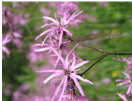
Afbeelding 6: Oude beemden

In het zuiden van natuurgebied de Zig heeft