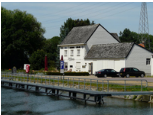
Afbeelding 15: Passantensteiger Tongerlo