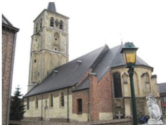
Afbeelding 2: Tongerlo

Tongerlo is een dorp in de Belgische provincie Limburg, en een deelgemeente van de stad Bree. Het was een zelfstandige gemeente tot het bij de fusie van 1971 toegevoegd werd aan de gemeente Opitter die op zijn beurt in 1977 werd opgenomen in de gemeente Bree.