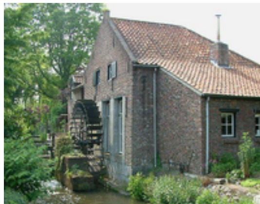
Afbeelding 8: Armenmolen

De Armenmolen is een van de weinige overgebleven watermolens aan de Ittersebeek te Neeritter. Deze onderslagmolen was in gebruik als korenmolen. De oudste schriftelijke vermelding van een molen op deze plaats is van 1280. Ook in 1535 werd een Armenmolen gebouwd, maar niet duidelijk is of deze