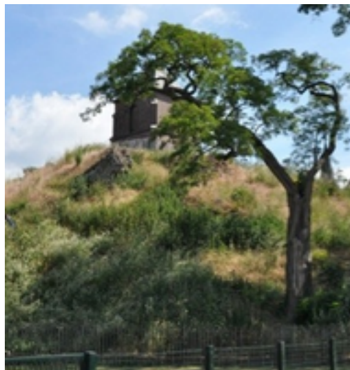
Afbeelding 9: Versterking bij de Maas

Natuurgebied Koningssteen-Kollegreend ligt vlakbij het Maasdorp Kessenich. In de tijd van de Kelten stroomde de Maas langs dit dorp, maar in de loop der eeuwen verlegde de Maas meermaals haar bedding. Zo is de verlande Maasmeander en het