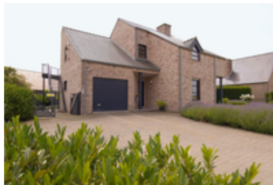
Afbeelding 12: De Blauwe Trap

"vakantieverblijf ""lakerdijk"" ligt in het pittoreske