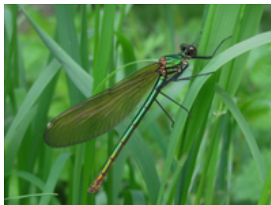
Afbeelding 4: Water vol leven