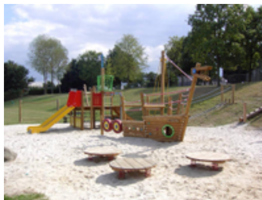
Afbeelding 10: De Spaanjerd