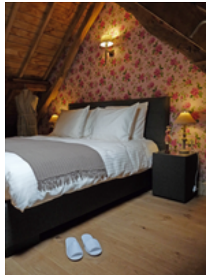
Afbeelding 16: De Keyartmolen