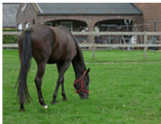
Afbeelding 13: De Geisterse Hei