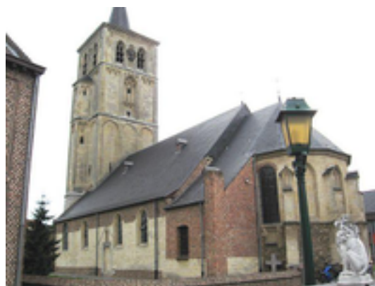
Afbeelding 1: Sint-Pieterskerk

De kerk was de dochterkerk van de Sint-Pieterskerk van Elen, welke gesticht was door de Abdij van Corbie. De Tongerloze kerk werd voor het eerst vermeld in 1295.