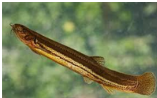
Afbeelding 7: Grote modderkruiper

In de beken van natuurgebied de Goort leeft de grote modderkruiper. Deze vissoort leeft in stilstaande wateren met modderige of zandige bodem en heeft zich aangepast aan omstandigheden in verlandende habitats. In het Vlaamse deel van het Maasbekken werd de soort tot nu toe enkel in de Zig en de Goort waargenomen. Maar de grote modderkruiper waarnemen is moeilijk, omdat hij, zoals zijn naam het zegt, weggekropen in de modder leeft. Wetenschappers ontdekten de soort door onderzoek van waterstalen. Daarin werd het DNA