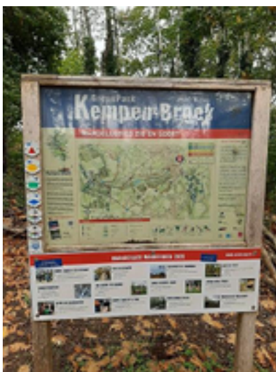
Afbeelding 5: De Zig

De Zig is een natuurgebied dat zich bevindt tussen Kinrooi en Molenbeersel. Het gebied is ruim 66 ha groot en wordt beheerd door Limburgs Landschap vzw.