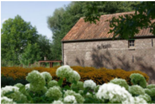
Afbeelding 14: B&B De Keyartmolen

gelegen langs de Zuid Willemsvaart, waar u heerlijk kunt wandelen, fietsen, ruiteren en mennen. Deze B&B beschikt over een eigen wellness ruimte.