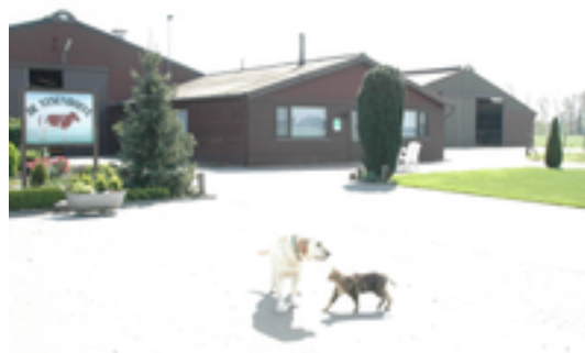
Afbeelding 3: De Nysenhoeve